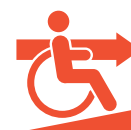
AIDE AU HANDICAP

CPRN - Action sociale - 43, avenue Hoche - 75008 PARIS - 01 53 81 75 00 - action.sociale@cprn.fr