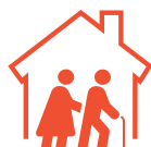
AIDE FINANCIÈRE EN MAISON DE RETRAITE